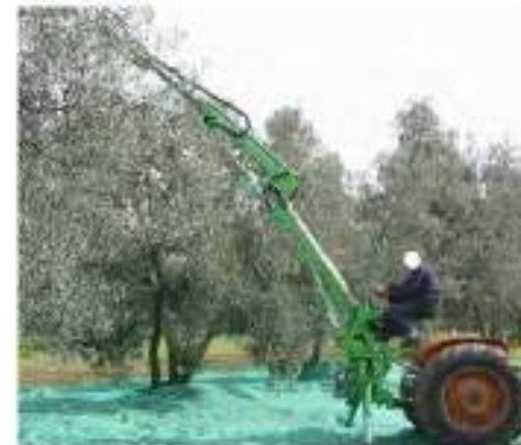
Abbacchiatore collegato al trattore