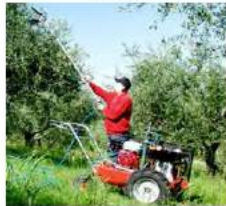
Abbacchiatura meccanizzata con abbacchiatore portatile